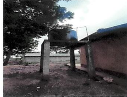
Foto 2: Sustitución de Rotoplast de 3,000 litros y cambio de accesorios de baños.